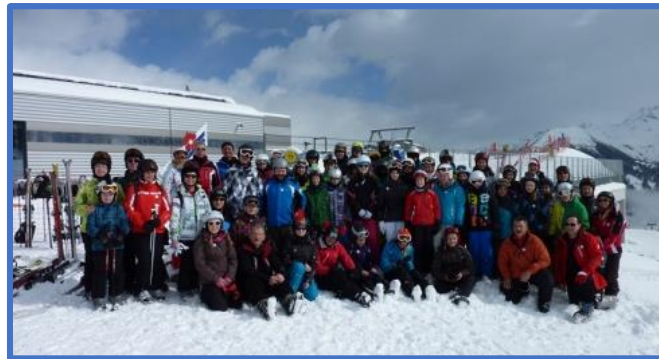
Bild 2: Bundesjugendspiele